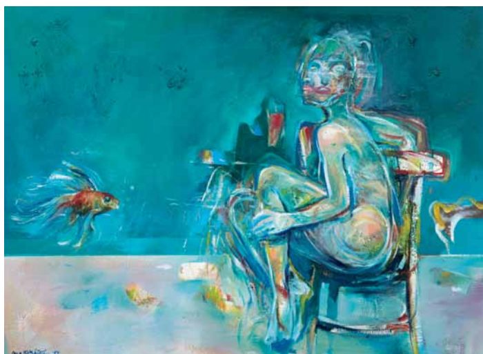
Tri želania, 1994